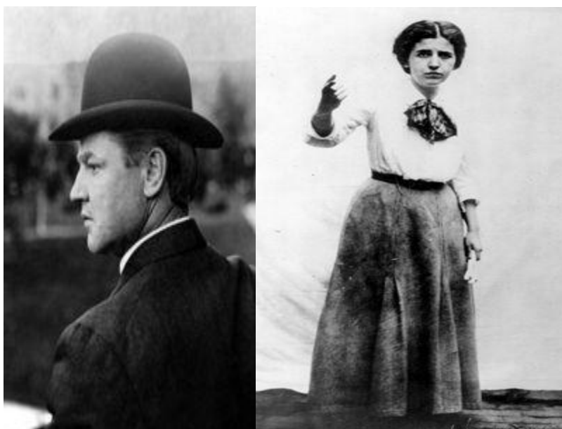
William Haywood e Elizabeth Gurley Flynn